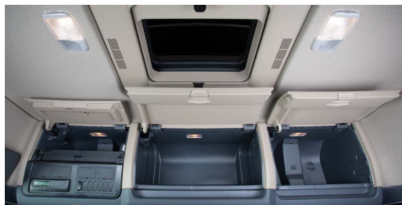
Верхние вещевые полки с люком в крыше