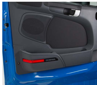
Внутренняя сторона двери