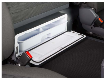
Задний вещевой ящик