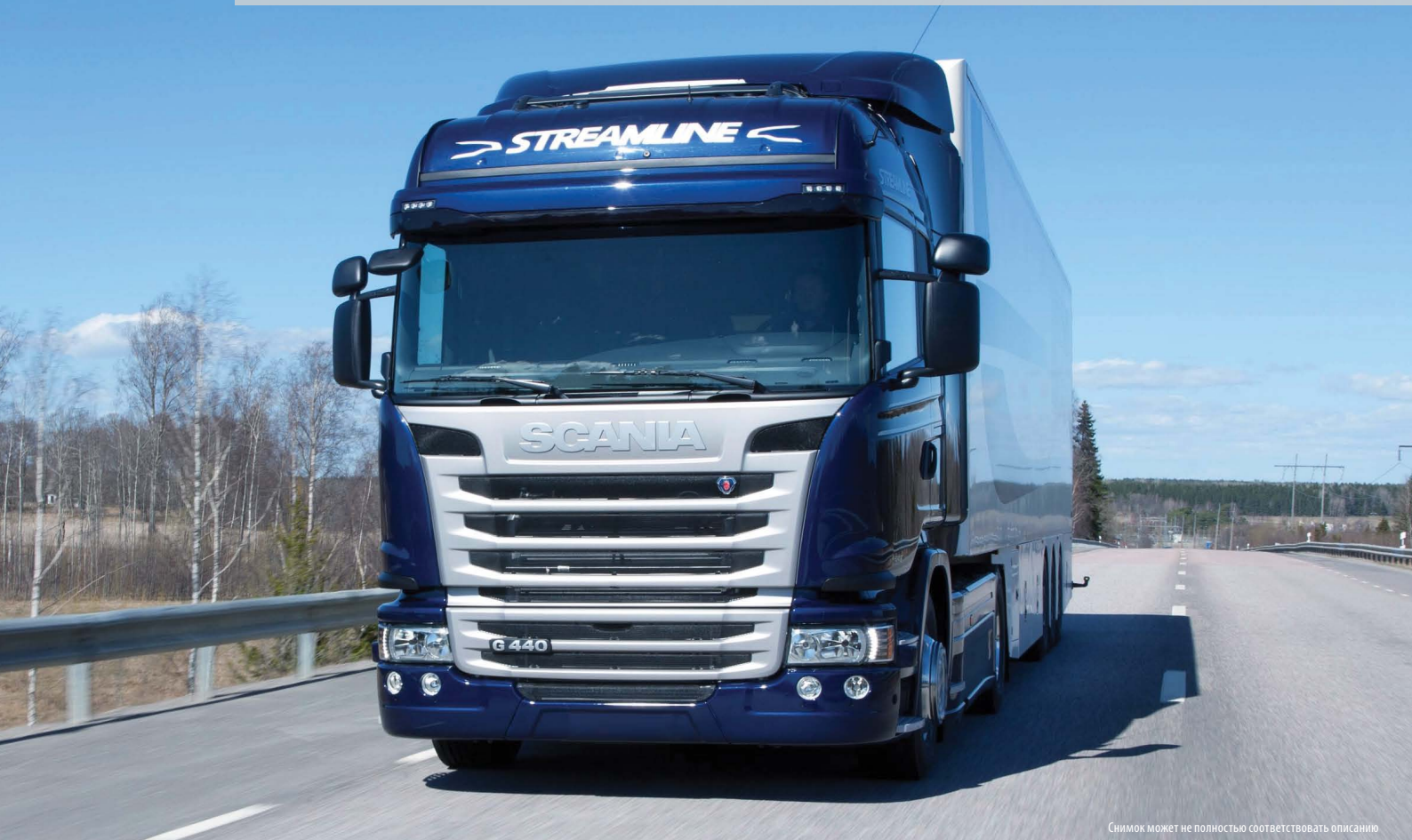
Снимок может не полностью соответствовать описанию