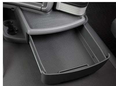
Передний вещевой ящик