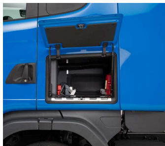
Наружный вещевой ящик