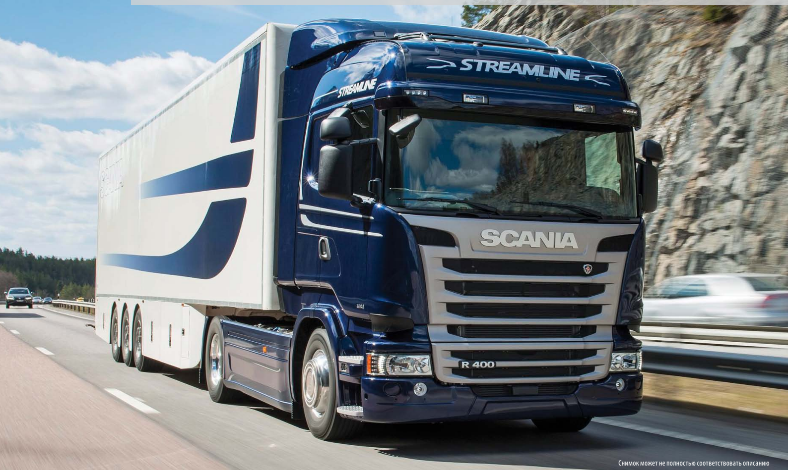
Снимок может не полностью соответствовать описанию