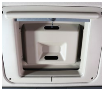
Люк в крыше