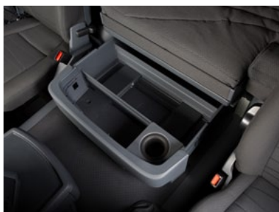
Задний вещевой ящик