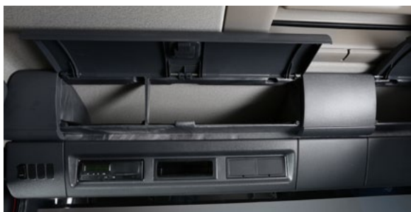
Верхние вещевые полки