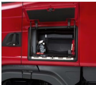
Наружный вещевой ящик