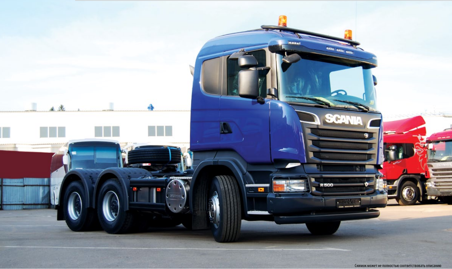
Снимок может не полностью соответствовать описанию