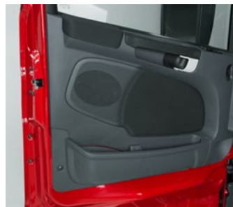
Внутренняя сторона дверей