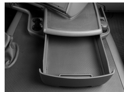
Передний вещевой ящик