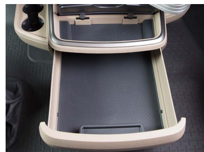
Передний вещевой ящик