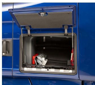
Наружный вещевой ящик