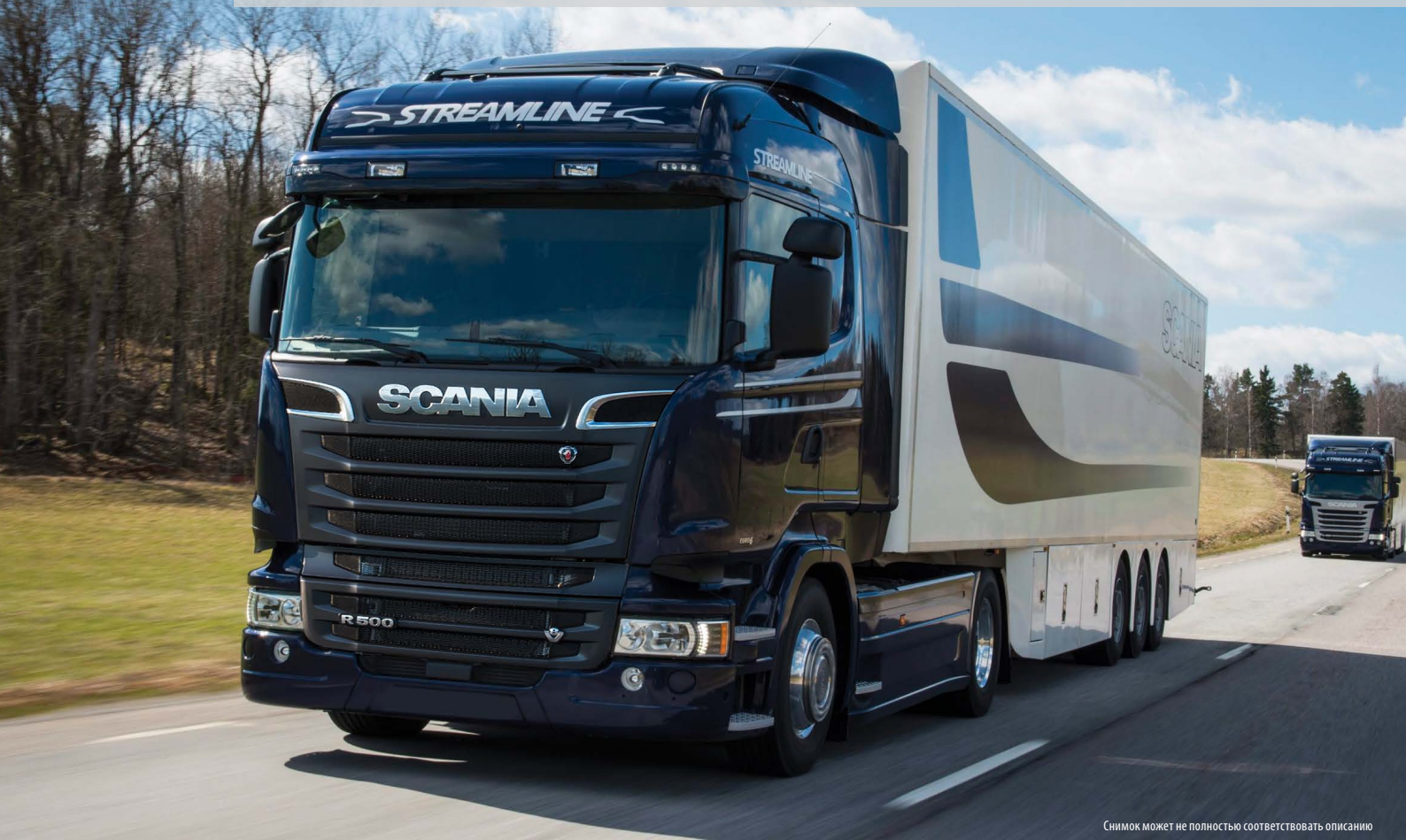
Снимок может не полностью соответствовать описанию