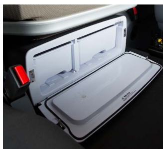
Задний вещевой ящик