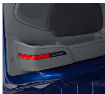
Внутренняя сторона двери