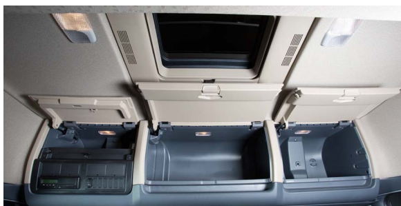
Верхние вещевые полки с люком в крыше